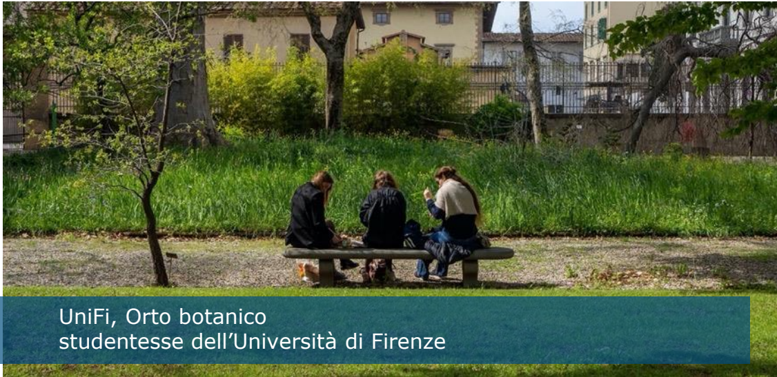
UniFi, Orto botanico studentesse dell'Università di Firenze

La Tavola rotonda intende presentare i risultati e i lavori di progetti del dipartimento di scienze giuridiche finanziati sul tema evidenziando problemi all'attenzione dei professionisti del diritto che il next generation lawyer deve essere pronto ad affrontare.